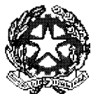
TABELLA A (legge 30 dicembre 2018, n. 145 art. 1, comma 301, lett. e)

ASSEGNAZIONE RISORSE PER ASSUNZIONI A TEMPO INDETERMINATO a valere sulle disponibilità del fondo dello stato di previsione della spesa del Ministero dell'economia e delle finanze ex articolo 1, comma 365, lett. b) della legge 232 del 2016, come rifinanziato dall'art. 1, comma 298, della legge n. 145 del 2018, pari per l'anno 2019 ad € 130.725.000 milioni, per l'anno 2020 ad € 328.385.00 milioni e a decorrere dall'anno 2021 ad € 433.913.00 milioni annui